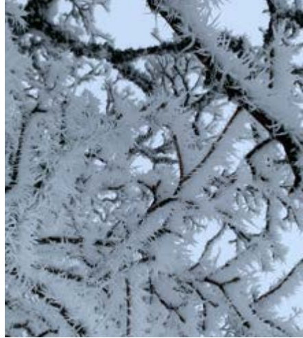
Wunder der Natur auf Rittmarren – erlebe diese bei einem Besuch unserer Hütte

Samstag ab 10.00 Uhr bis Sonntag 16.00 Uhr