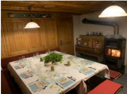
Erlebe unsere Hütte in gemütlichem Rahmen.